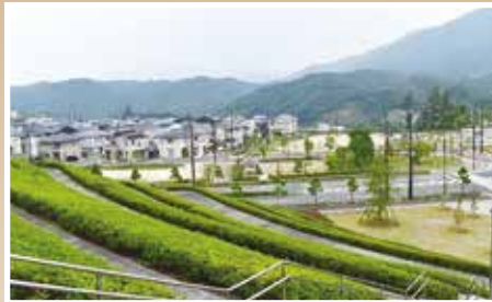
造成時の相談案件も増加しています