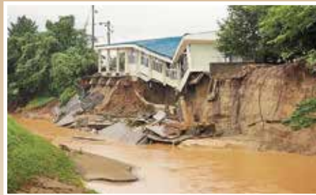
昨今河川災害が多く聞かれます