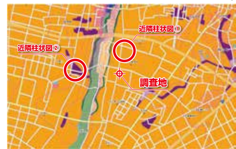
地域により、土地条件図は表示できない場合があります。

まずは、お電話・メールにてお気軽にお問い合わせください。 TEL 029-246-9511 MAIL arc@arc.co.jp